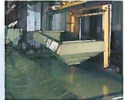
Etape importante du nouveau traitement anti-corrosion SULKY : le trempage par un robot dans un bain de peinture d'apprêt

* avec rehausse ** en équipement de base avec enterrage LS 2.20